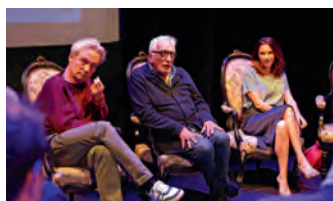
Un château de cartes au Théâtre des Lices début 2025