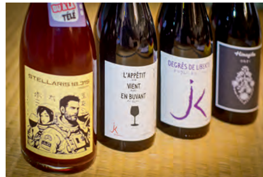
L'abus d'alcool est dangereux pour la santé. À consommer avec modération.