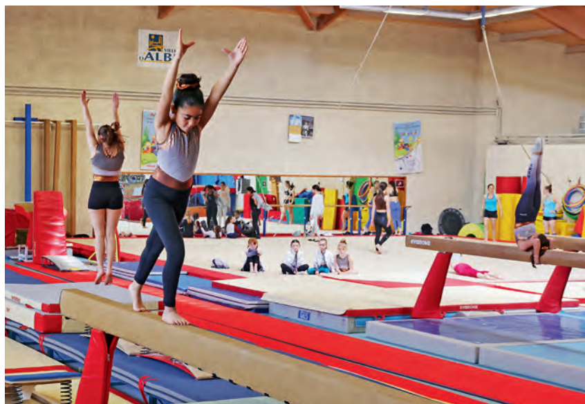
Le Salto albigeois a connu à la rentrée un boom des inscriptions.

Chez Roots Bmx, on affiche complet, JO ou pas. « Urban festival, fin août, nous offre à chaque fois une belle vitrine et permet une première prise de contact avec les jeunes intéressés », note-t-on au club. Pas sûr que les ados aient suivi les épreuves cet été ou, s'ils l'ont fait, ils sont vite passés à autre chose. Au club tennis de table de l'ASPTT, la rentrée a été bien animée avec beaucoup d'adhésions, le succès des frères Lebrun aux JO y ayant contribué. Sport populaire et accessible, le tennis de table est de fait destiné à un large public, de 4 à 99 ans. L'offre albigeoise est large, entre loisirs et compétition, mais propose aussi des créneaux entreprise ou encore Ping santé (+ 60 ans). Si effet JO, il y a donc eu, les clubs ne comptent pas se reposer sur leurs lauriers et se tournent déjà vers l'avenir en préparant les champions de demain. La communication, le bouche-à-oreille, la qualité de l'encadrement, certains événements, les portes ouvertes, la fête des associations en 2025 seront autant de moyens pour mettre le sport à l'honneur et inciter les Albigeois à pratiquer... toute l'année !