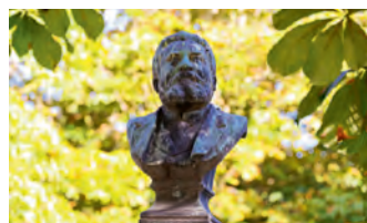
Les 100 ans de la panthéonisation de Jean Jaurès