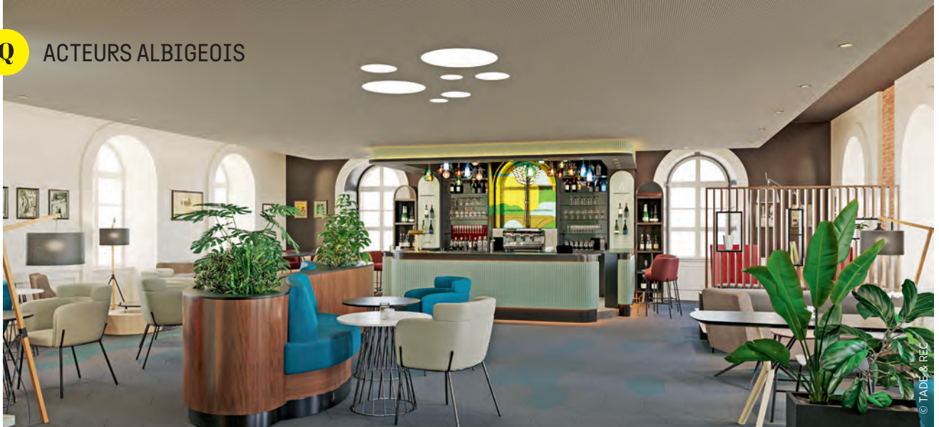
Image du bar de l'hôtel Mercure dont la vue panoramique sera unique sur la Cité épiscopale.