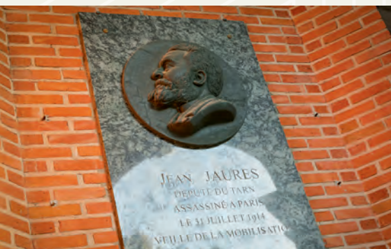
Jean Jaurès figure sur le monument aux morts d'Albi.