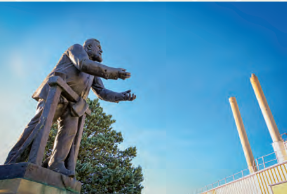
La statue de Jean Jaurès devant la VOA.